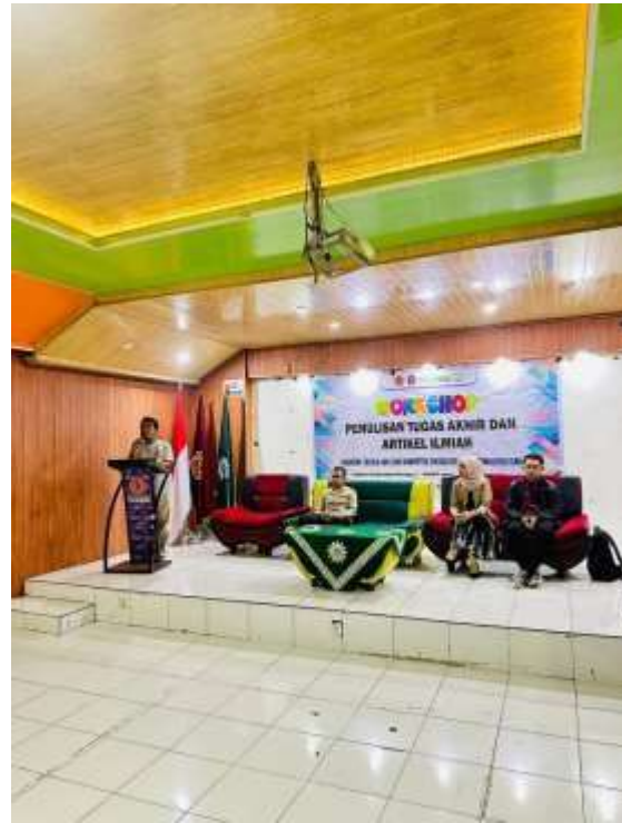
Gambar 3. Penyampain Materi oleh Narasumber Gambar 4. Penyampain Materi oleh Narasumber

Selain itu, pengenalan dan praktik penggunaan aplikasi Mendeley membantu mahasiswa dalam mengelola referensi secara lebih efektif dan efisien. Mahasiswa menjadi lebih memahami cara memasukkan referensi, melakukan sitasi otomatis, serta menyusun daftar pustaka sesuai dengan gaya penulisan ilmiah yang ditentukan. Hal ini sejalan dengan temuan penelitian sebelumnya yang menyatakan bahwa penggunaan aplikasi manajemen referensi dapat meningkatkan kualitas penulisan karya ilmiah mahasiswa.