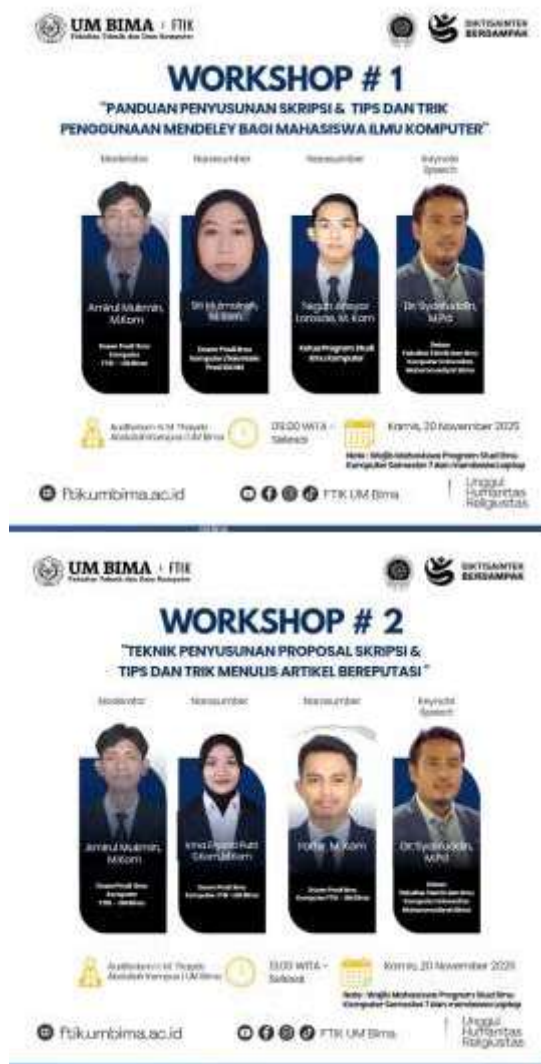
Gambar 1. Proses Pelatihan Pengabdian Masyarakat