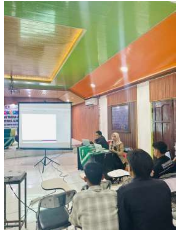
Gambar 2. Penyampain Materi oleh Narasumber

Hasil kegiatan menunjukkan bahwa sebagian besar mahasiswa sebelumnya masih mengalami kesulitan dalam menyusun proposal skripsi secara sistematis, khususnya dalam merumuskan latar belakang masalah, menentukan fokus penelitian, serta menuliskan sitasi dan daftar pustaka secara benar. Melalui kegiatan pelatihan ini, mahasiswa memperoleh pemahaman yang lebih baik mengenai struktur proposal skripsi dan pentingnya penggunaan referensi ilmiah yang relevan.